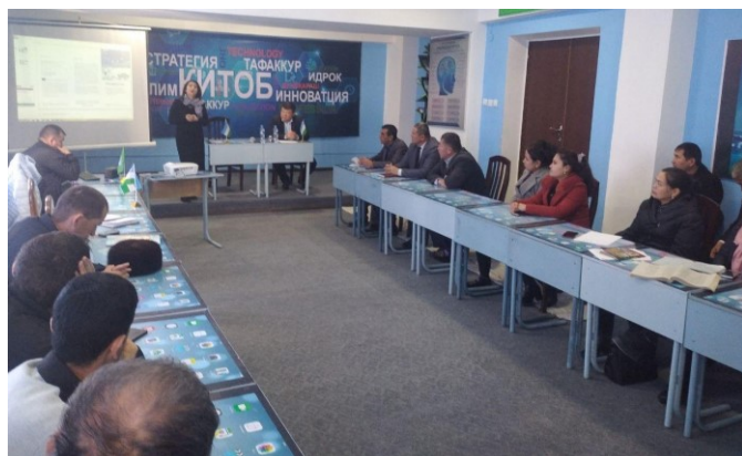
Информационная встреча, г. Карши, Узбекистан, 20.02.2020 Information meeting, Karshi, Uzbekistan, 20.02.2020.

Then, during the work of the 'Curriculum' group, supported by a methodologist, educational programs for technical and vocational education were developed, namely for the qualifications as: «Housing manager» (5th level of the National / Sectoral Qualifications Framework (NQF / SQF) and «Caretaker» (3rd level of the NQF / SQF).