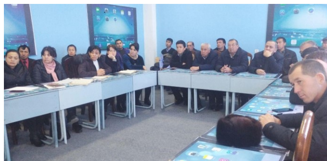
Информационная встреча, г. Карши, Узбекистан, 20.02.2020 Information meeting, Karshi, Uzbekistan, 20.02.2020

с представителями местных властей по развитию сервисных услуг по обслуживанию многоквартирных домов и развитию деятельности управляющих организаций. По итогам встреч представители местных властей выражали готовность поддержке реализации проекта PROMHOUSE и установлению партнёрских отношений с Ассоциацией. Так как потребность в профессиональных специалистах в регионах очень высокая, Ассоциация уже начала предоставлять услуги по повышению квалификации. Первые два вебинара по теме 'Делопроизводство в профессиональных управляющих организациях' были проведены в консорциуме с консалтинговым центром «Kelajak Shahri Rivoji».