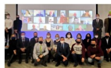
Участники международного семинара МАМН, 9-10 декабря 2020

В течение 2020 года проект успешно кооперировал с другими международными инициативами. Ещё в 2019 году через проект PRO HOUSE, предшествующий проекту PROMHOUSE, были установлены связи между Немецким энергетическим агентством dena и Министерством жилищно-коммунального обслуживания (МЖКО) Узбекистана в области модернизации жилого фонда. Из инициативы совместного Круглого стола (PRO HOUSE, 20.09.2019) выросла идея проекта - энергетической модернизации одного жилого дома, как пилотного объекта, чтобы продемонстрировать на практике большой потенциал экономии энергии при комплексной термомодернизации. Год спустя, 23.10.2020 состоялось совместное мероприятие партнёров проекта PROMHOUSE (из Узбекистана - Ассоциации организаций профессиональных управляющих и обслуживающих жилищный фонд и МЖКО, из Германии - ИВО, dena), где речь шла о профессионализации процесса санации жилого фонда, квалификации собственников жилья. На данный момент для пилотного дома разработаны и обсуждены концепции энергосберегающей санации, выбран оптимальный вариант, проект вступает в стадию планирования. И параллельно планируется следующая встреча, где будет продолжен диалог dena с МЖКО о стратегии развития широкомасштабной энергетической модернизации жилого фонда в Узбекистане.