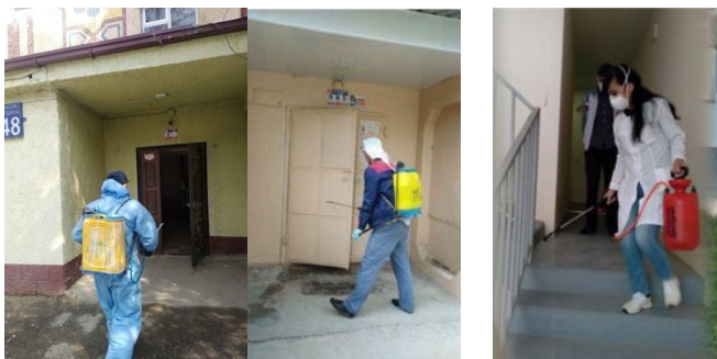
Дезинфекции, проводимые в домах жилищными управляющими компаниями и ТСЖ в Узбекистане, 2020 Disinfections of buildings, conducted by the housing management companies and HOAs in Uzbekistan, 2020

The 10 articles on PROMHOUSE topics written by experts in housing management, project partners and journalists were widely disseminated in the partner countries (see the website https://uyushma.uz/publikacii ). Particular attention was paid to the topics of dual education, development of sector certification, caretaker and of course the topic of coping with the consequences of the coronavirus pandemic.