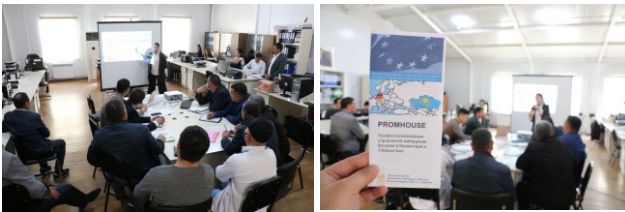
Information meeting, Nurafshan, Uzbekistan, 9 April 2021.

On 9 April, an information event with the heads of management companies of Tashkent region on the 'Legislative Basis for the Management of Multi-Apartment Residential Buildings' took place.