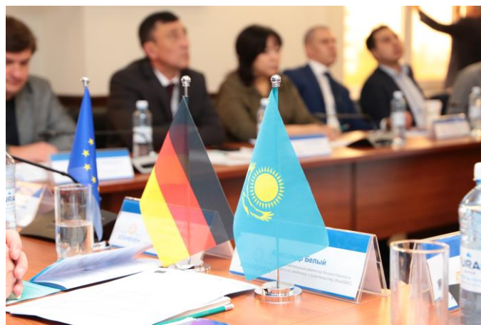
Круглый стол в г. Астане, Казахстан, 29.06.2023

29 июня 2023 г. в г. Астане состоялся круглый стол «Профессиональное управление жилой недвижимостью и энергетическая модернизация жилого фонда». Мероприятие прошло при участии Представительства Европейского Союза в Казахстане, Национальной Палаты Предпринимателей РК «Атамекен», Министерства индустрии и инфраструктурного развития (МИИР) РК, Казахстанского центра модернизации и развития ЖКХ и Института развития электроэнергетики и энергосбережения.