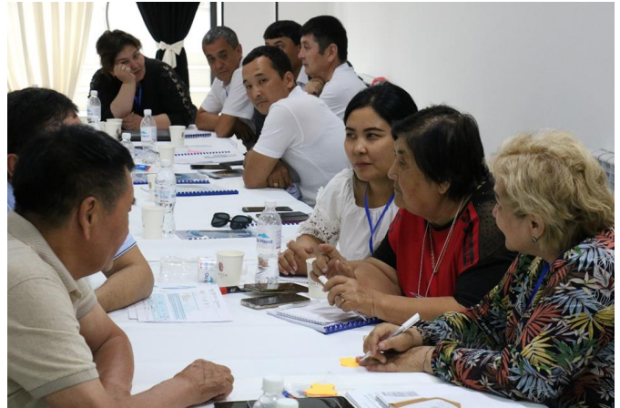
IV. Фаза ToT, Семинар в г. Бухара, Узбекистан, 16.05.2023 IV. ToT Phase, Seminar in Bukhara, Uzbekistan, 16.05.2023

According to the Law on Management of multi residential, management organizations must train and certify at least two of their employees. The training is conducted by the State Unitary Enterprise "Kommunalukow", which is a monopoly organization for advanced training of employees of management companies and homeowners' associations. There are no training programs to train and build capacity in soft skills, and international occupational standards are just beginning to be developed. At the moment, the professional standard "Housing Manager" has been approved, and the standard "Housing and Communal Services Specialist"