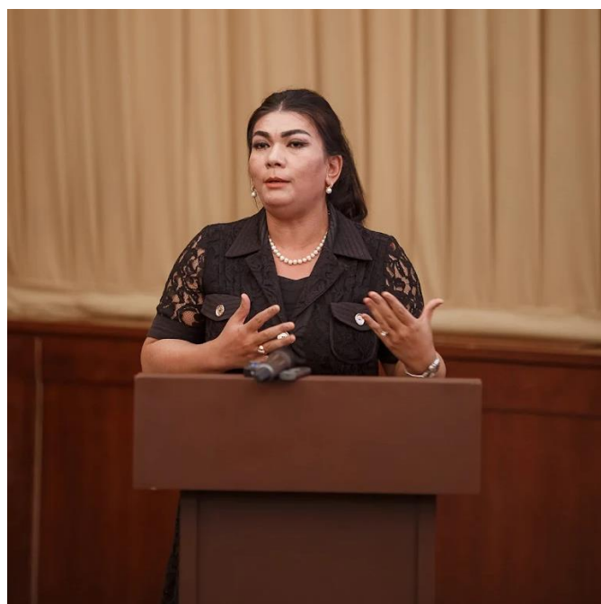
Ozoda Juraeva, Заместитель министра строительства и жилищно-коммунального хозяйства Узбекистана Конференция «УПРАВЛЕНИЕ И СОДЕРЖАНИЕ ЖИЛИЩНОГО ФОНДА В УЗБЕКИСТАНЕ И КАЗАХСТАНЕ»

сталкиваются управляющие компании, и каким образом они преодолевают эти трудности. Отмечено, что в ближайшей перспективе планируется создание рабочей группы, которая будет заниматься анализом и обсуждением предложений, поступивших из разных областей страны относительно реформы. Работа в этом направлении продолжается и остается активной.