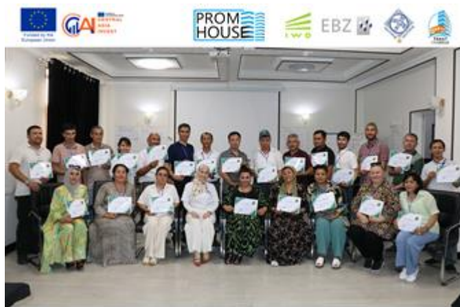
IV. Фаза ToT, Семинар в г. Бухара, Узбекистан, 16.05.2023

IV. ToT Phase, Seminar in Bukhara, Uzbekistan, 16.05.2023